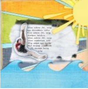
Csak egy ötlet