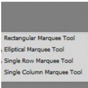
Photoshop a legelejétől – Kijelölő eszközök