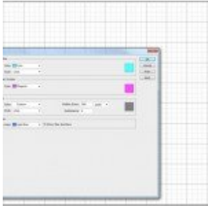
Photoshop a legelejétől – Rulers, grid és guides