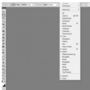
Photoshop a legelejétől – paletták