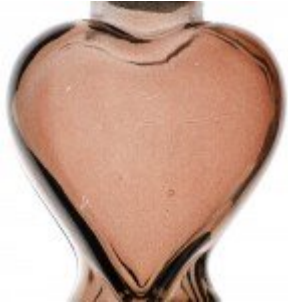
Üvegbe zárt szörnyek