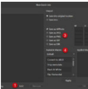
Affinity Photo - kötegelt feldolgozás