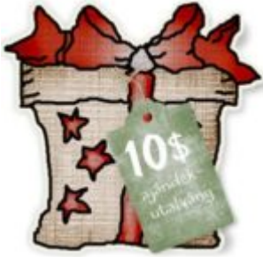
Cewe heti kihívás 25.