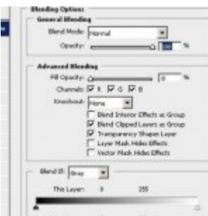
Layer Style avagy rétegstílus 1