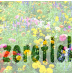
Gyorstipp - képes betű