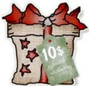
Cewe heti kihívás 25.