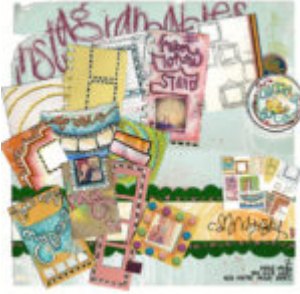
Cewe Fotókönyv heti kihívás 178. győztese