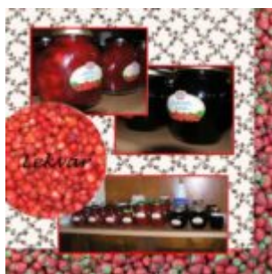
Blog Action Day 2011