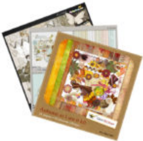
Cewe Fotókönyv heti kihívás 174. győztese