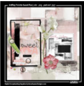
Cewe Fotókönyv heti kihívás 164. győztese