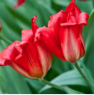
Haladó filter használat