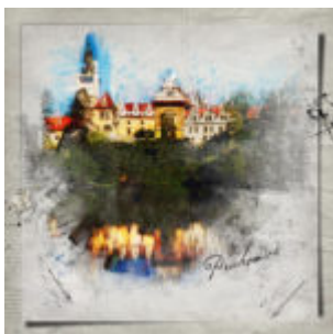
Postworkshop – recept 1.