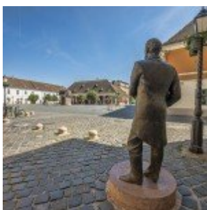
HDR - mert egyszerű