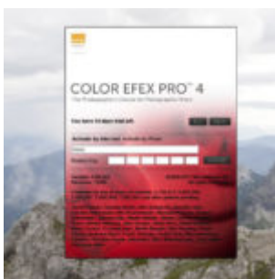
Kiegészítő pluginok - Nik Color Efex Pro 4