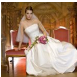
Kiegészítő pluginok - Alien Skin Exposure 4