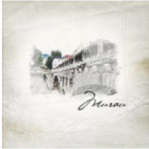
Kiegészítő pluginok - PostworkShop