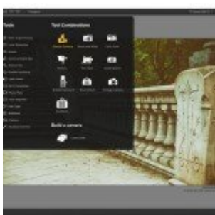
Google Nik Collection