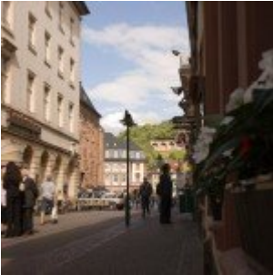
Camera Raw - bővebben