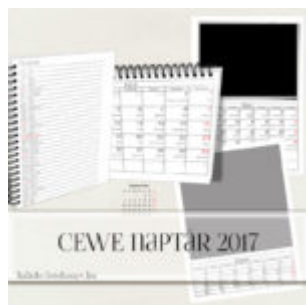
CEWE naptár 2017.