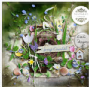
Cewe Fotókönyv heti kihívás 145. győztese