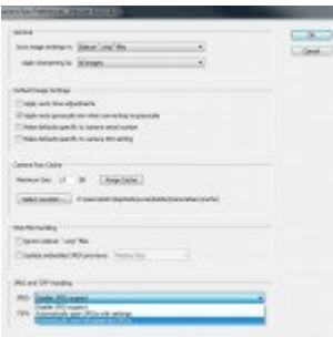
Camera Raw presets