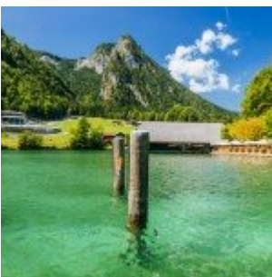
Utazási fotótípek - pakolás, tervezés