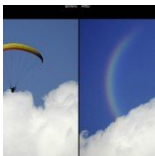
Kiegészítő pluginok - PhotoTools