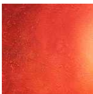
Ezt meg kell venni!