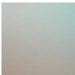
Black Friday Sale