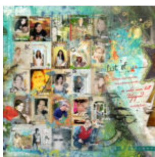
2. Nagy CeWe Tali!