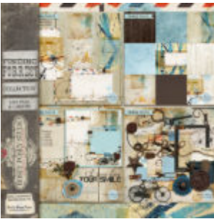
Cewe Fotókönyv heti kihívás 189. győztese