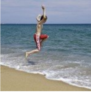
Mit nekem iNSD