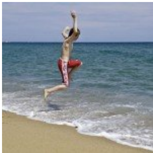
Mit nekem iNSD