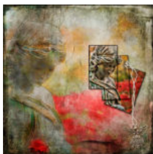
Adobe Watercolour Assistant