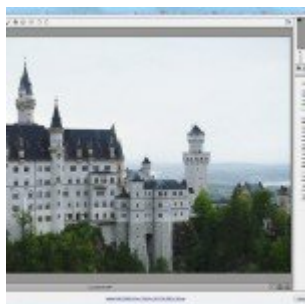
Ég, ha kék