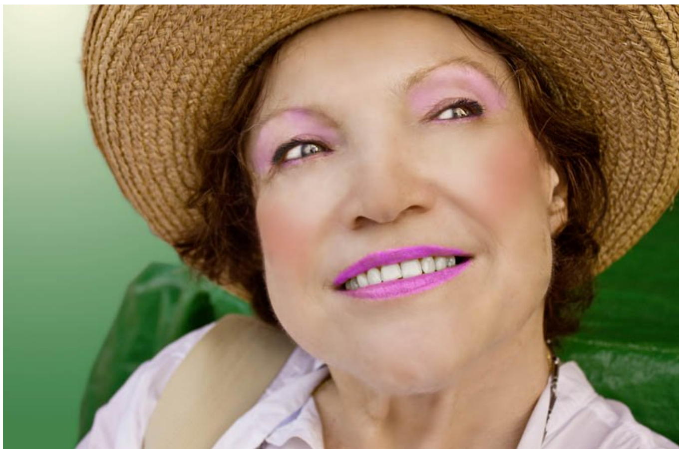
Before retus After

És bizonyítékként, hogy egy csecsemőt is lehet retusálni:) Így is gyönyörű, makulátlan a bőre, de egy kis korrekcióval: