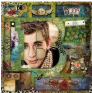
Réteg stílus tipp