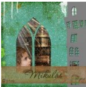
Fény az ablakból