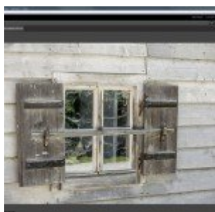
Perfect Photo Suite 8