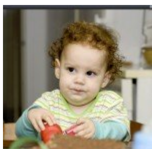
Kiegészítő pluginok - Perfect Photo Suite 6