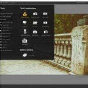
Google Nik Collection