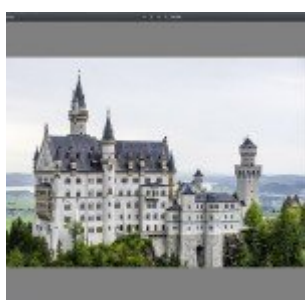
Kiegészítő pluginok - Topaz ReStyle