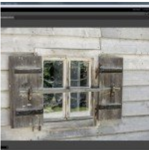
Perfect Photo Suite 8