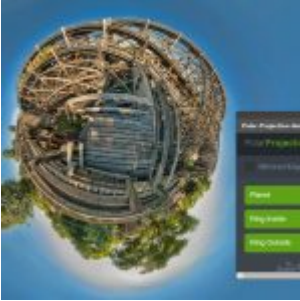
The Orange Box