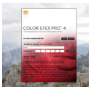
Kiegészítő pluginok - Nik Color Efex Pro 4