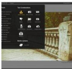
Google Nik Collection