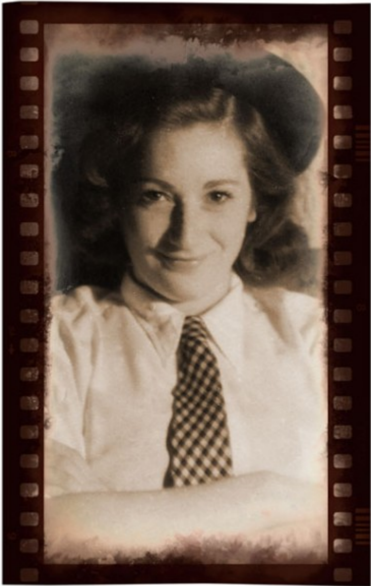
Na, még egy utolsó: