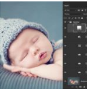
Miért is használj korrekciós rétegeket