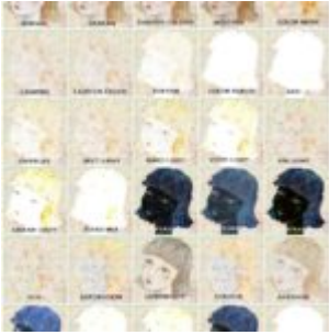
Affinity Photo - blending