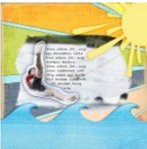
Csak egy ötlet