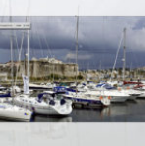
Crop avagy a képek vágása