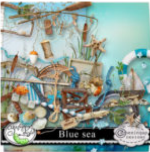
Cewe heti kihívás 110. győztese