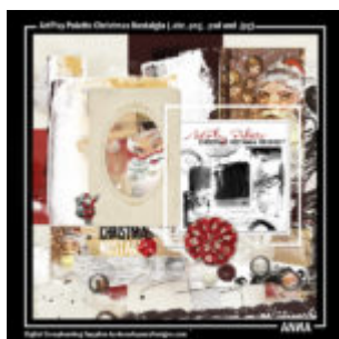
Cewe Fotókönyv heti kihívás 185. győztese