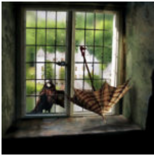
Esős ablak Photoshop-ban