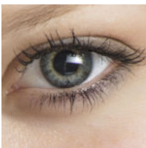
Bird's Eye View