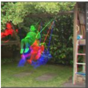
Harris Shutter Effect