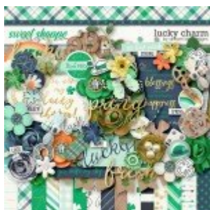
Cewe Fotókönyv heti kihívás 354. győztese