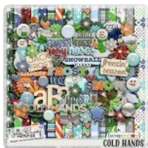
Cewe Fotókönyv heti kihívás 342. győztese