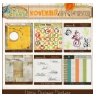
Cewe heti kihívás 77. győztese