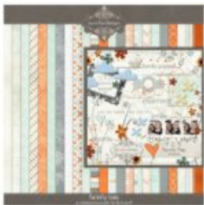
Cewe heti kihívás 36. győztese