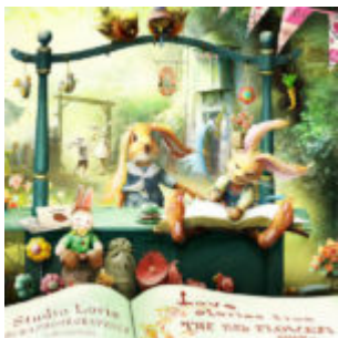
Cewe Fotókönyv heti kihívás 151. győztese