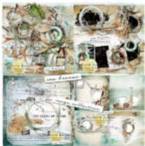
Cewe Fotókönyv heti kihívás 202. győztese