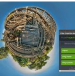
The Orange Box