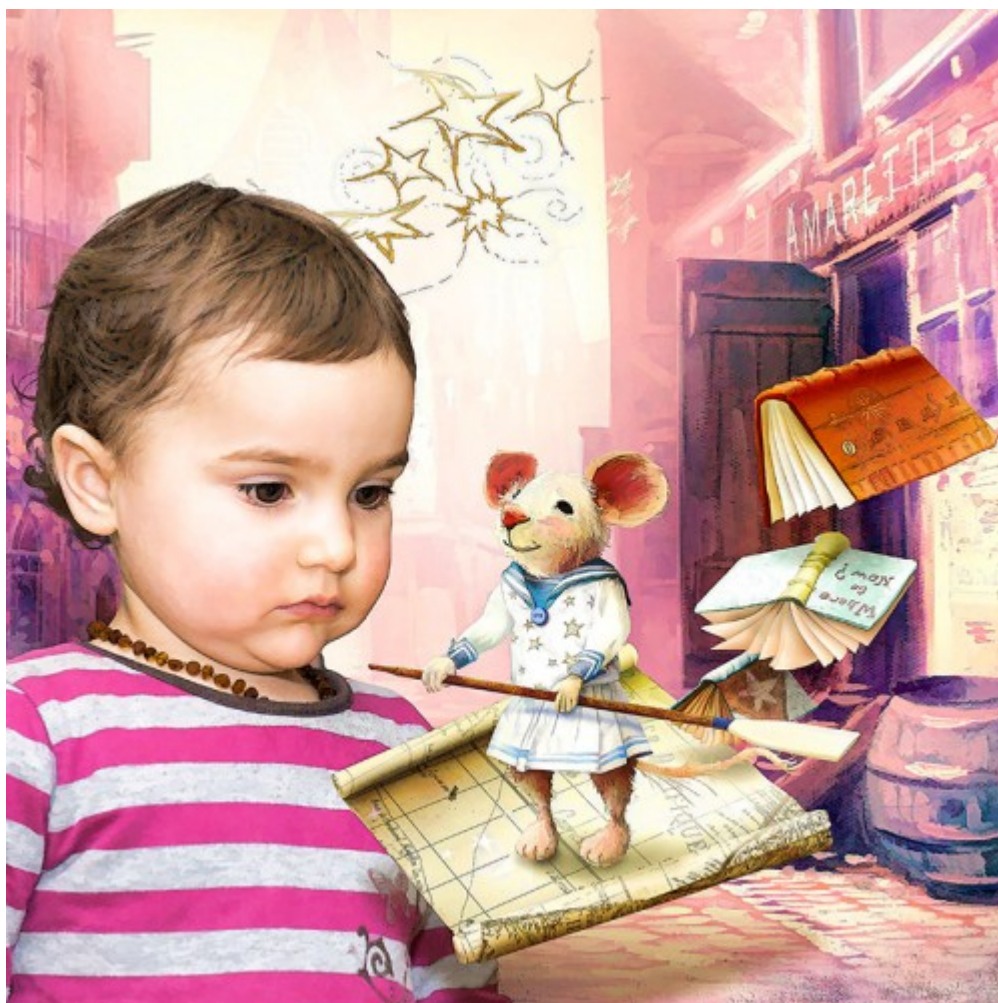
Egymás mellé tettem az eredeti, nem is túl jó fotót.