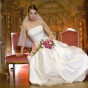
Kiegészítő pluginok - Alien Skin Exposure 4