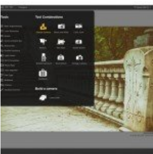
Google Nik Collection