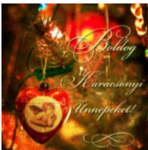
Boldog Karácsonyt mindenkinek!