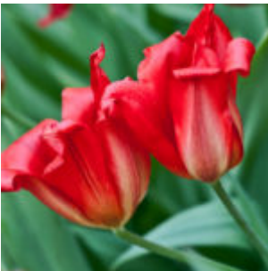
Haladó filter használat