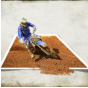
Affinity Photo – Out of Bound