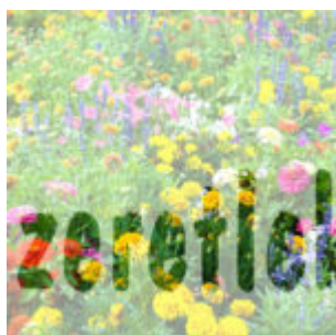
Gyorstipp - képes betű