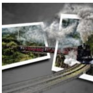
Out of Bound