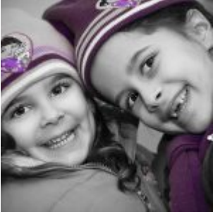
Camera Raw - videó