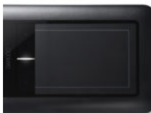
Tablet, avagy a digitalizáló tábla