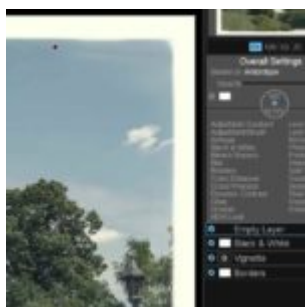
On1 Effects 10.5