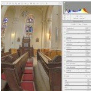
Camera Raw Adjustment Brush