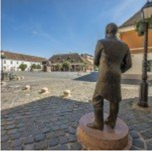
HDR - mert egyszerű