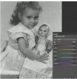
Régi fotók restaurálása