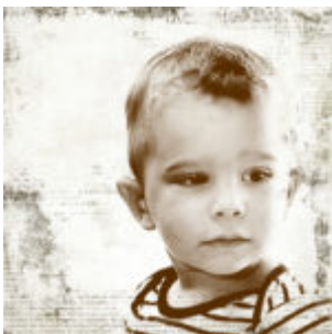
Nem kell mindig blinding