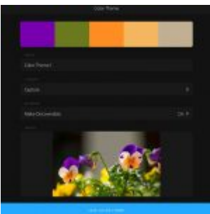
Adobe Capture CC