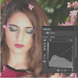
Matt fotó készítése Photoshop-ban