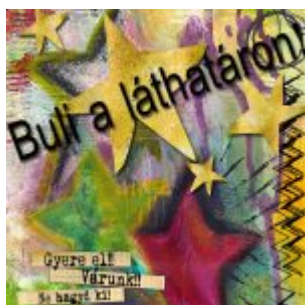
Buli a láthatáron!