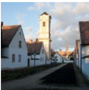
Kiegészítő pluginok – Topaz Adjust