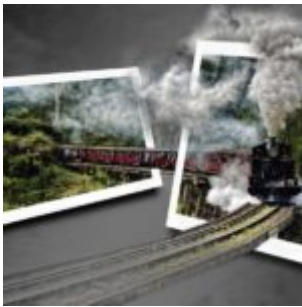
Out of Bound