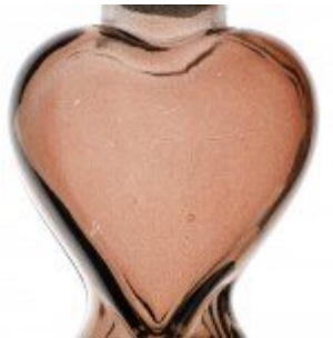
Üvegbe zárt szörnyek