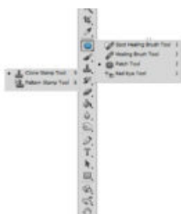
Photoshop a legelejétől - retusáló eszközök