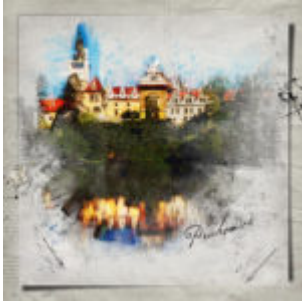
Postworkshop - recept 1.