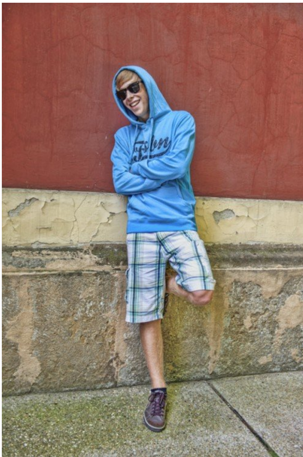
A csúszkák húzogatóásával lehet a fekete-fehér kép ilyen: