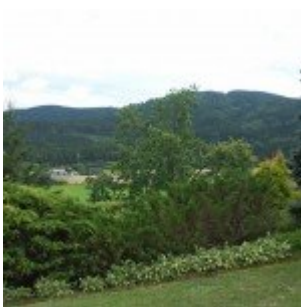
Advanced blending (Speciális összeolvastás)