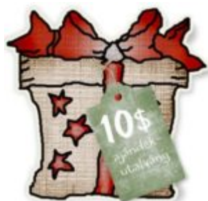
Cewe heti kihívás 25.