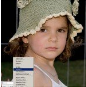
LAB color mód