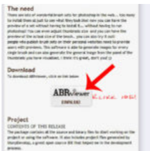
Digital Artist 2 - Photoshop ecsetek használata