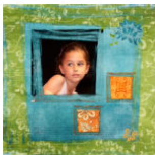
Digital Artist 2 - Maszkok használata