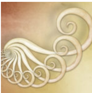
Step and Repeat