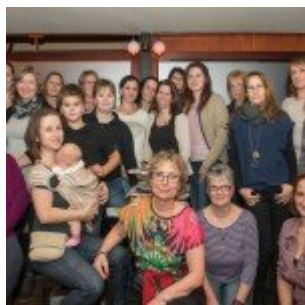
8. CEWE találkozó