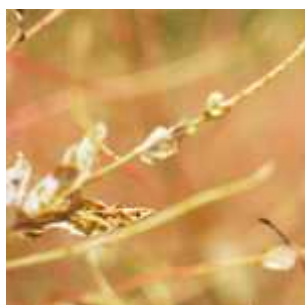
Még több gradient ötlet