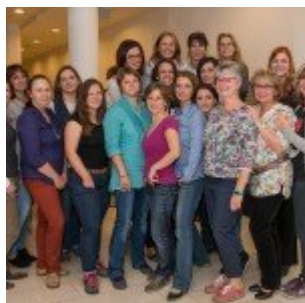
10. CEWE találkozó