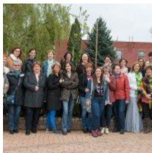
11. CEWE találkozó