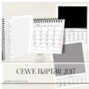
CEWE naptár 2017.

vere 16 items in your list. Here they are in random or