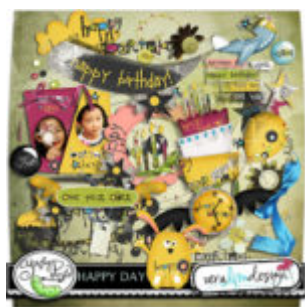
Cewe heti kihívás 48. győztese