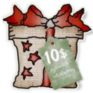
Cewe heti kihívás 93.