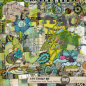
Cewe heti kihívás 73. győztese