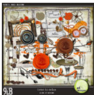
Cewe heti kihívás 66. győztese