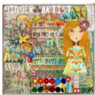
Cewe heti kihívás 112. győztese